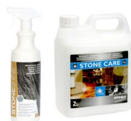
STONE SHINE / STONE CARE